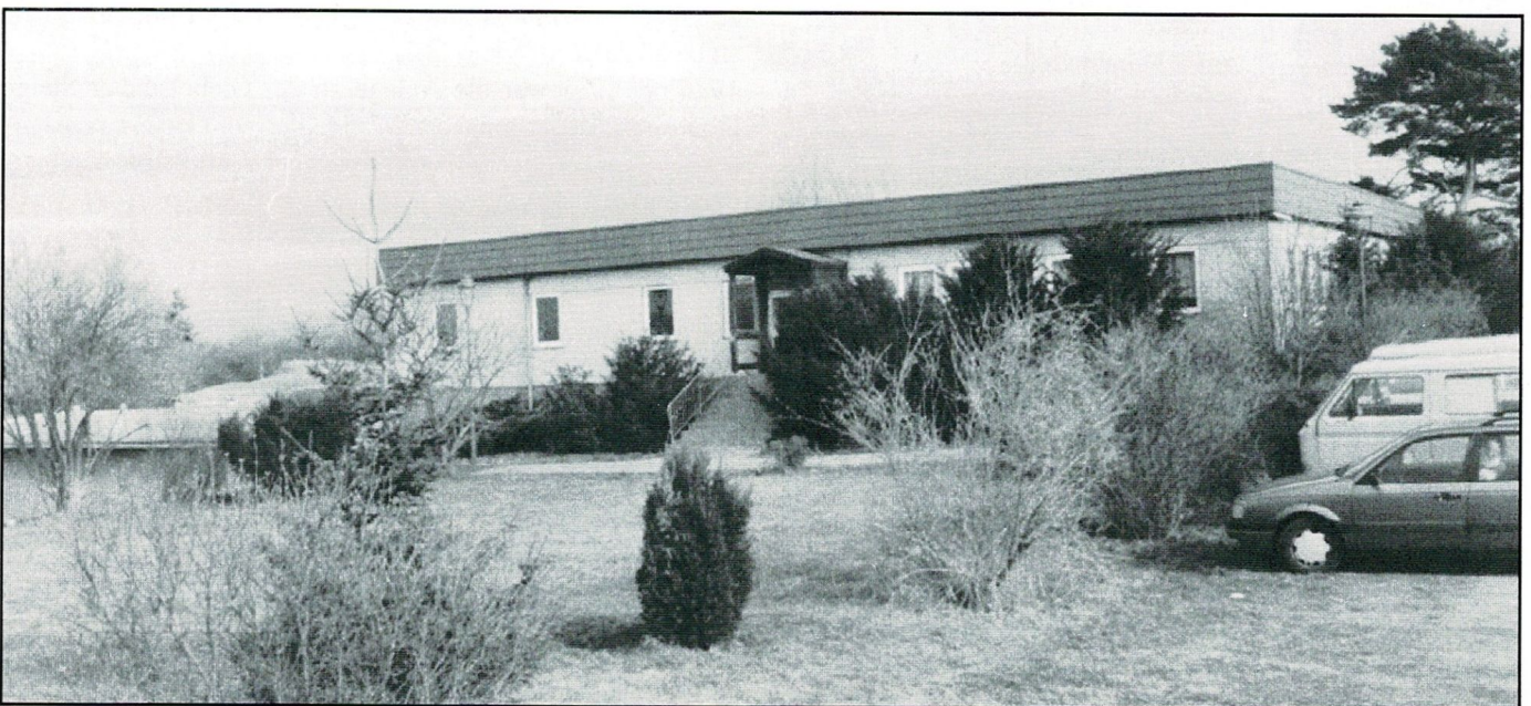
Das Schützenzentrum des Post SV