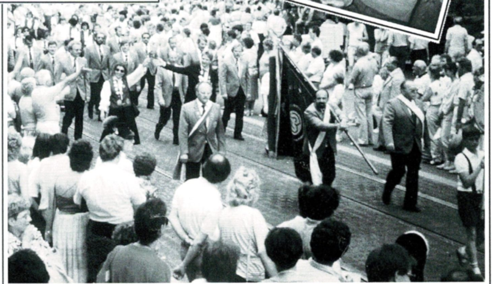
Die Postschützen beim Kiliani-Umzug