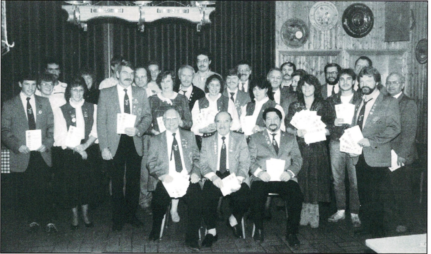
Meisterfeier bei den Postschützen